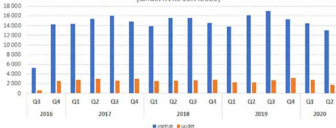
Uusien ja vanhojen asuntojen kaupat neljännesvuosittain 2016 Q3 - 2020 Q2 (lähde: KVKL 10.7.2020)

Ovaron Muun toiminnan asuntokanta on hajautunut hyvin ja on vanhojen asuntojen myynnin kokonaisvolyymiin verrattuna hyvin pieni.